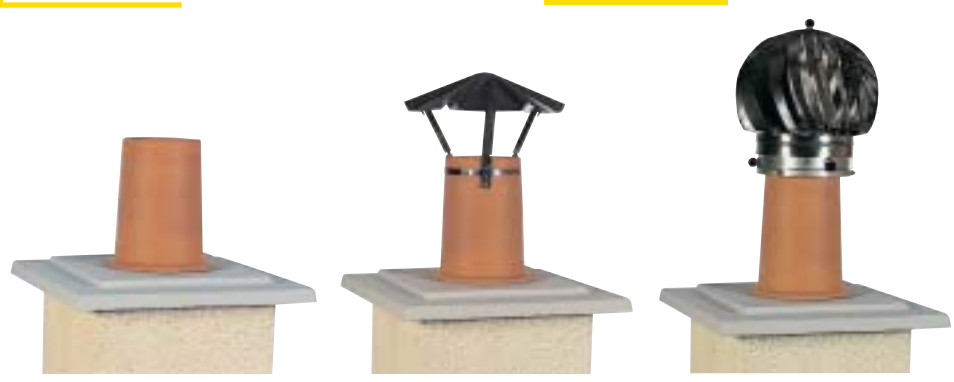
Bandodal avec mitre